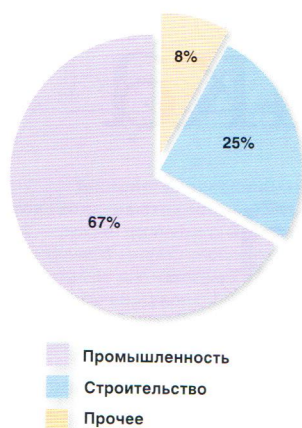
↑ РИС. 3. Структура потребления пеностекла в разрезе отраслей-потребителей, %