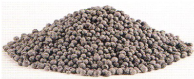
РИС. 1. Виды пеностекла: А, В — гранулированное; С, D — блочное.