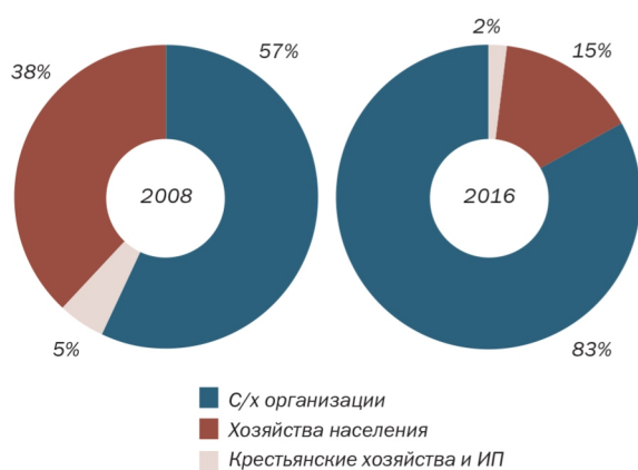
Рис. 2. Структура распределения поголовья свиней по хозяйственным субъектам, %

При этом объем потребления свинины в России в этот период значительно сократился: по итогам 2016 года объем рынка составил около 3,4 тыс. тонн, тогда как в 2013 оценивался в 3,8 тыс. тонн. Динамика потребления свинины в стране представлена на рисунке 3.