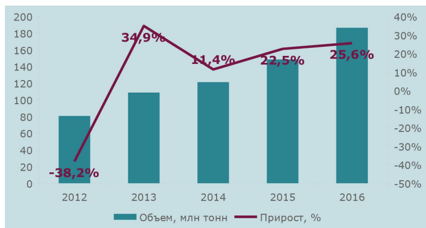
Рисунок 1. Динамика импорта сыра и сырных продуктов из Беларуси в 2012-2016 гг. (источник: «Текарт» на основании данных ФТС РФ, Белстат)

Молочная отрасль России находится сегодня в крайне непростом положении, к чему привела ее низкая инвестиционная привлекательность (в сравнении, например, со свиноводством, птицеводством) в условиях девальвации национальной валюты в 2014-2015 годах, когда инвестиции в модернизацию и развитие производства и переработки молока были существенно снижены. Увеличение стоимости кредитных ресурсов и себестоимости производимой продукции способствовало сохранению тенденции сокращения поголовья коров. Вместе с