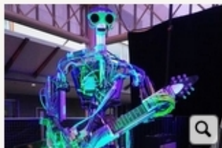
«Бал роботов» 7 фото