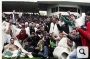
Взлет и падение проекта «Анжи» 12 фото